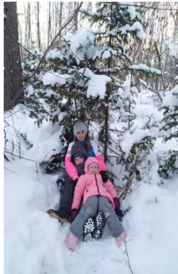
Семейные прогулки в зимний лес..