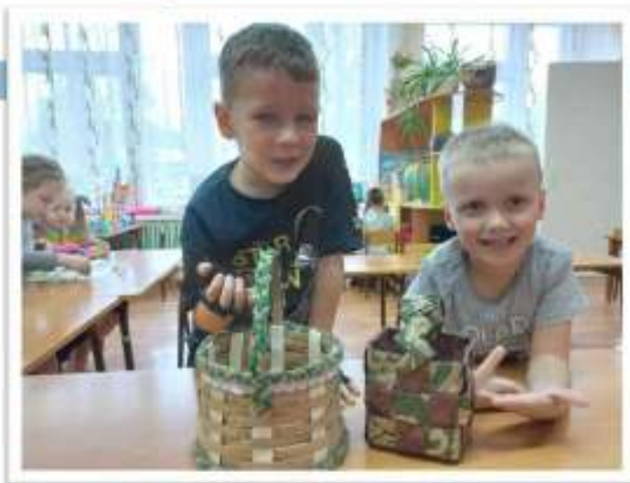
Корзинка из картонных полос и лукошко из флористических обоев