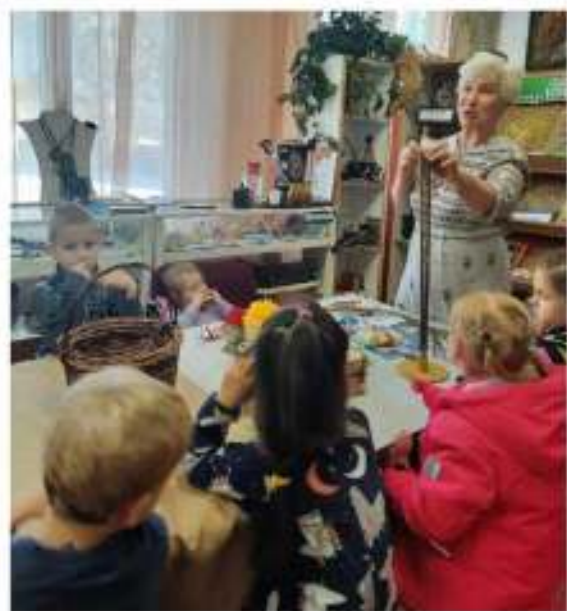
Посещение уголка русского быта в СДК Утулик