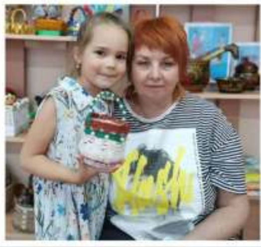
Карандашница из бумажного стакана и пряжи