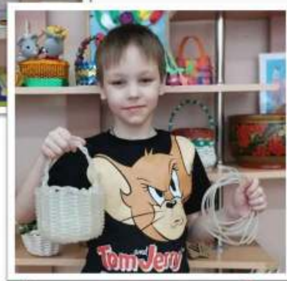
Корзинка из медицинских трубок для капельницы